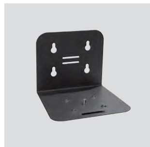
SLP-2 WALL MOUNTING PLATE