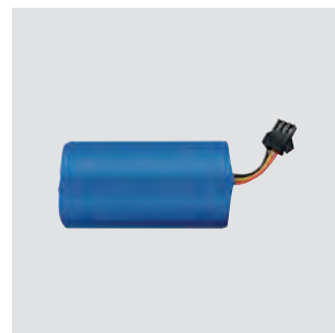
SLP-2 BATTERY Li-Ion 2200mAh