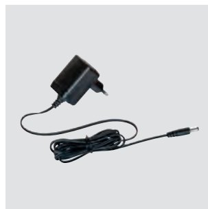
SLP-2 POWER SUPPLY